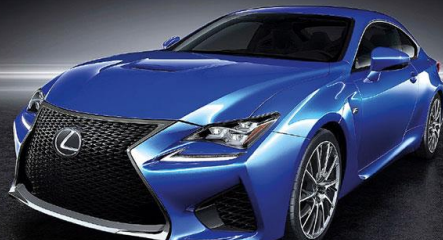
LEXUS RC F